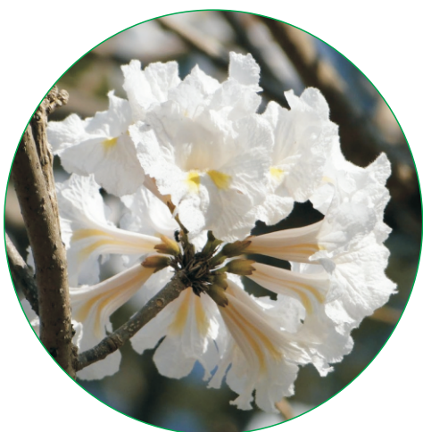
Folhas e flores