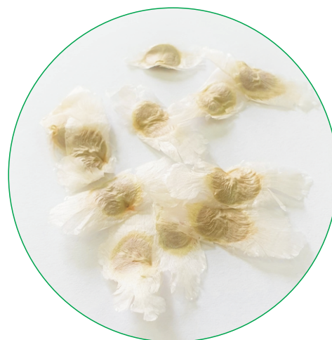
Frutos e sementes