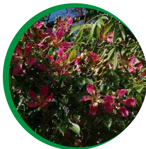
Folhas e flores