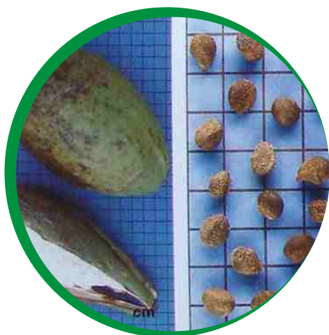
Frutos e sementes