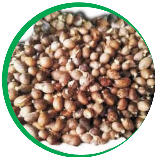
Fruto e sementes